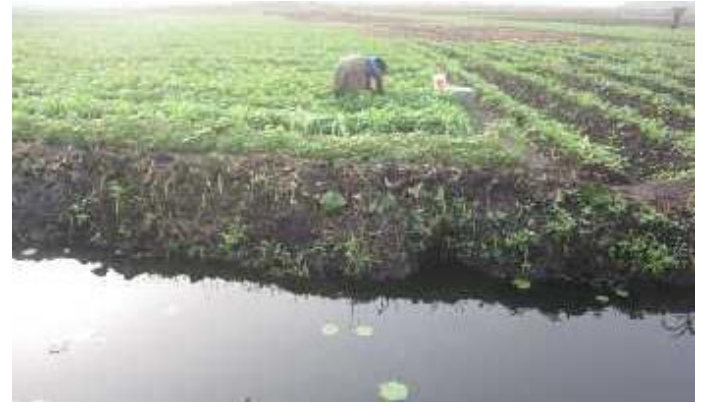
Figure 3. Mise en valeur des bas-fonds à Zoungù centre.