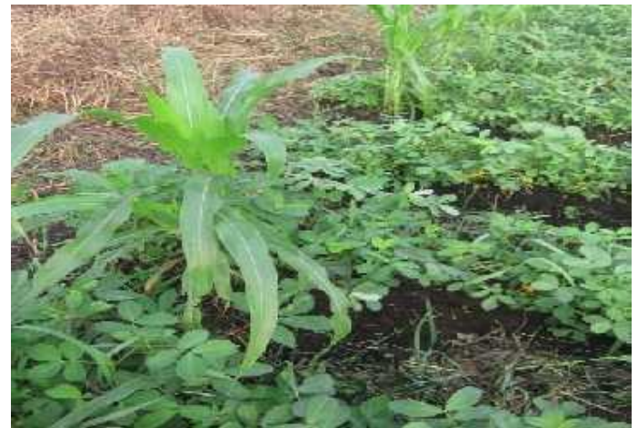
Figure 4. Association de cultures à Zoungù Tokpa. (Prise de vue : S. A. Zinsou, mars 2020)

La Figure 4 illustre l'association de l'arachide ( Arachis hypogea ) et du maïs ( Zea mays ) à Zoungù Tokpa. L'association de cultures consiste à produire deux ou trois cultures simultanément sur la même parcelle. Les paysans adoptent cette stratégie dans l'espoir que les conditions climatiques locales répondent aux exigences de l'une au moins des cultures associées.